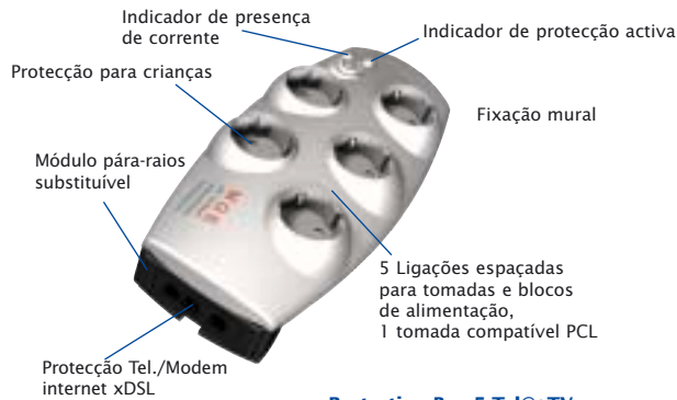
Protection Box 5 Tel@+TV