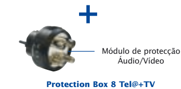
Protection Box 8 Tel@+TV